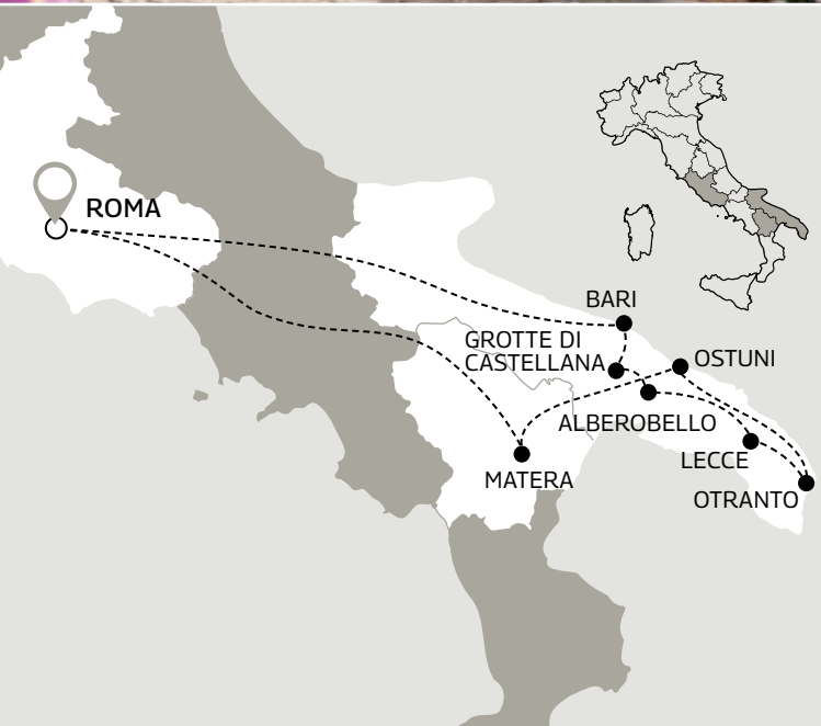
CALENDARIO SALIDAS LOS DOMINGOS