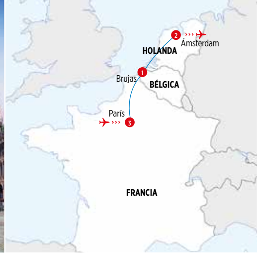
Grand Place · Bruselas