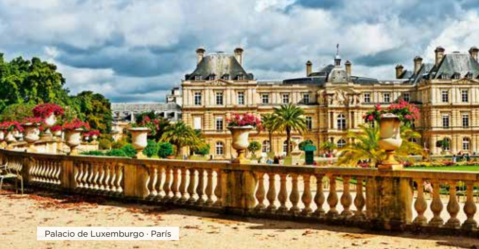
Palacio de Luxemburgo · París