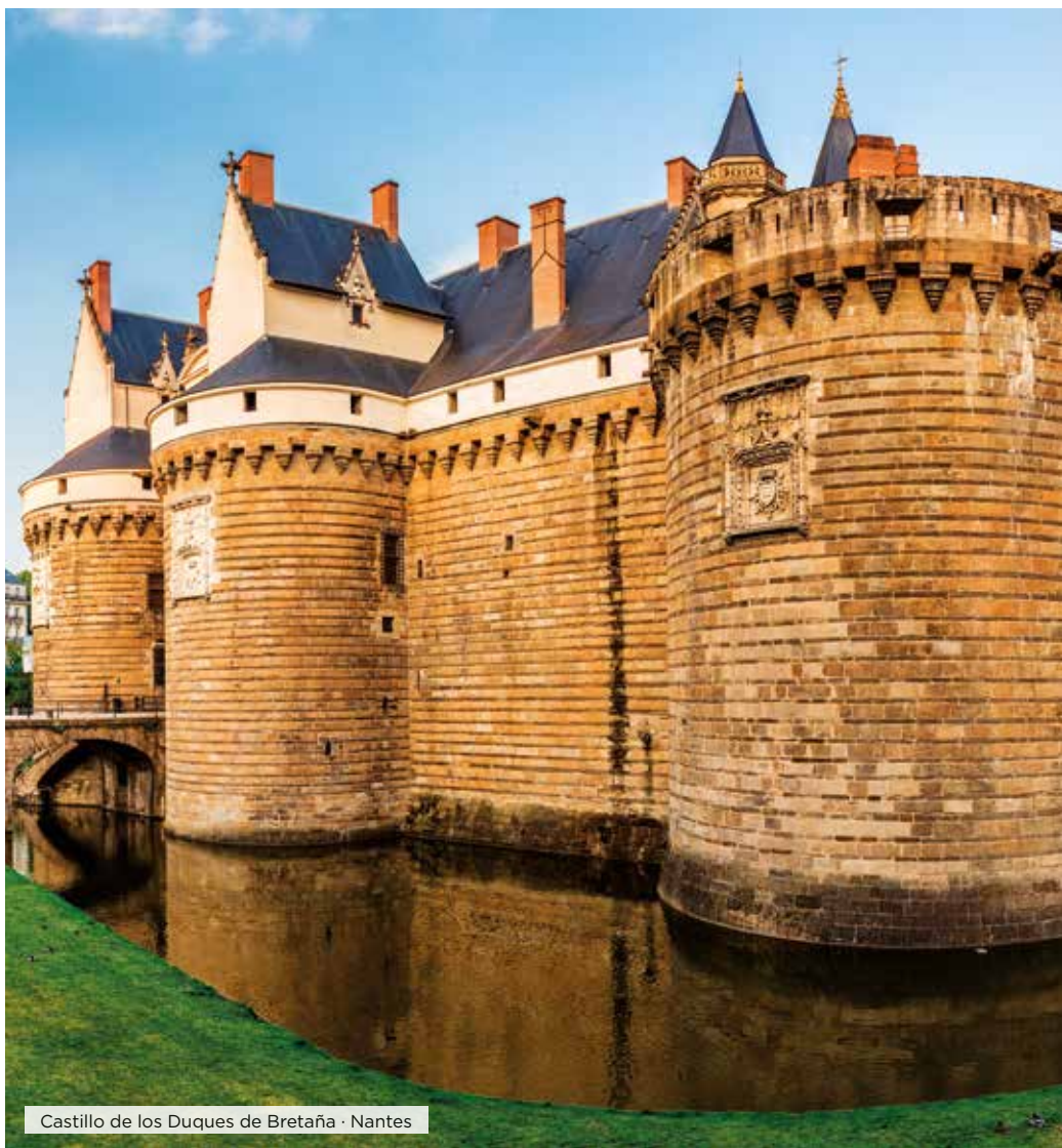
Castillo de los Duques de Bretaña · Nantes

Desayuno. Durante este día realizaremos un interesante recorrido por Bretaña y primeramente realiza-