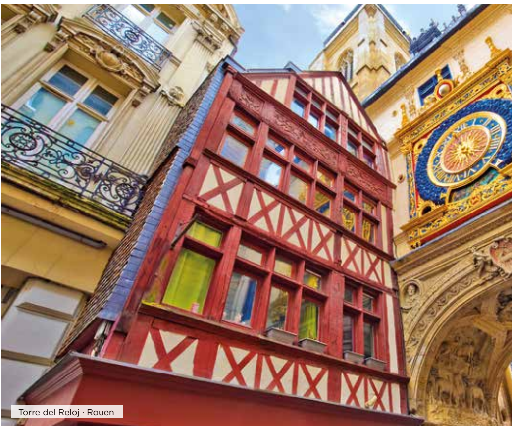
Torre del Reloj · Rouen

Desayuno. Durante este día realizaremos un interesante recorrido por Bretaña y primeramente realiza-