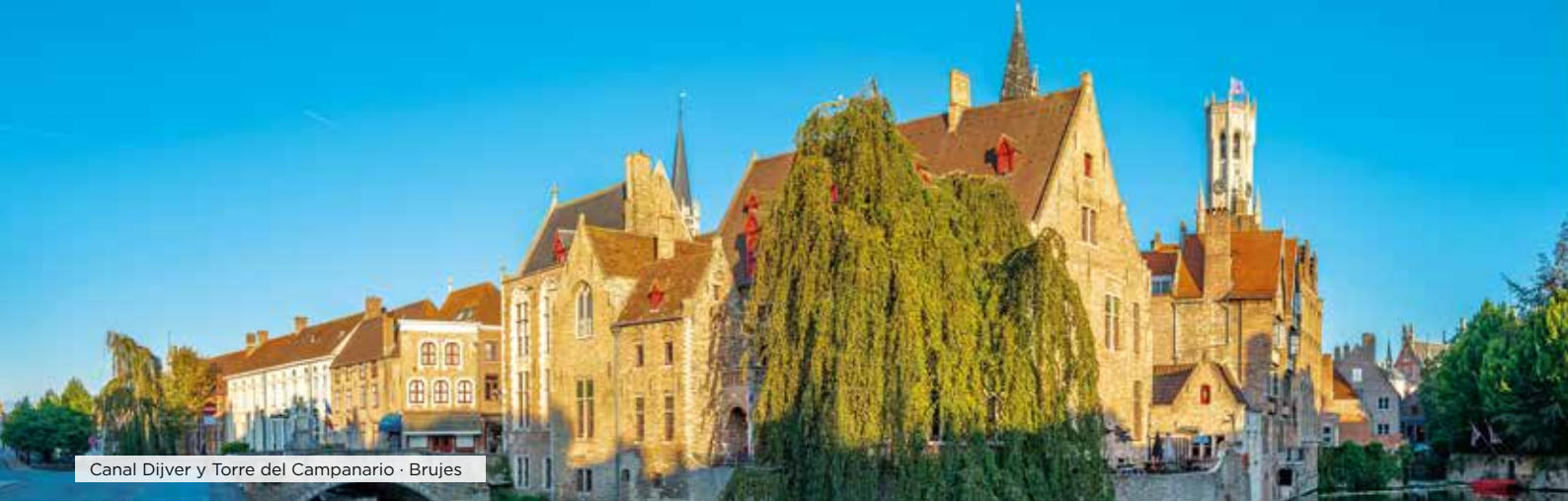
Canal Dijver y Torre del Campanario · Brujas