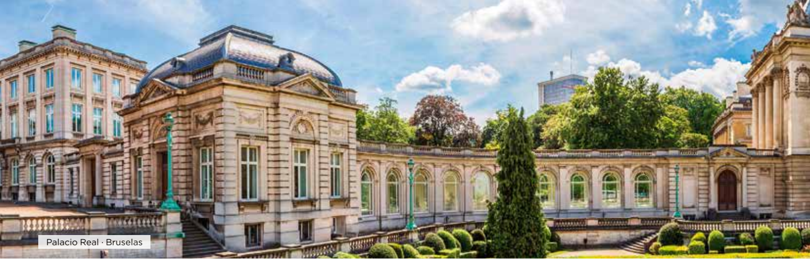
Palacio Real · Bruselas