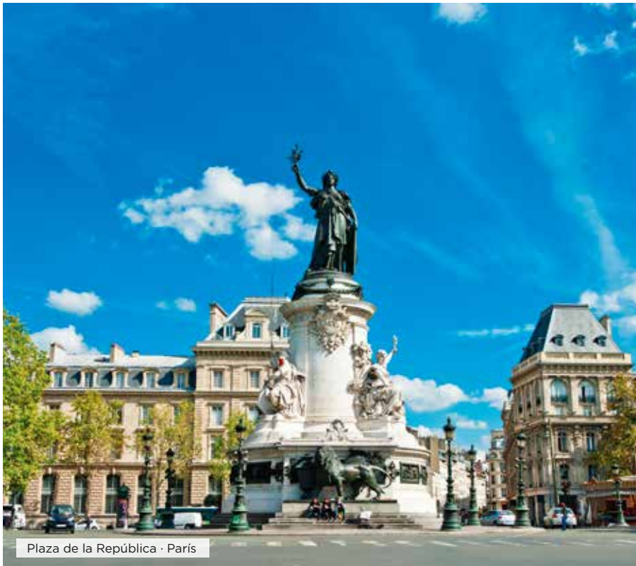
Plaza de la República · París

Desayuno. Tiempo libre hasta el momento del traslado al aeropuerto para tomar el vuelo a su ciudad de destino. Fin de nuestros servicios. ■