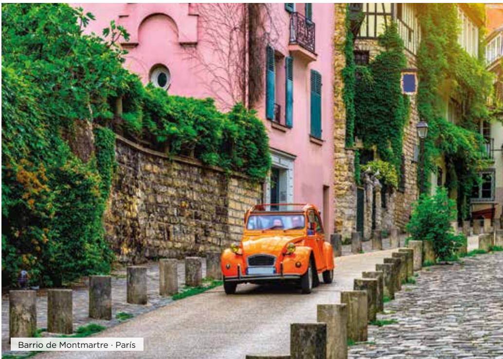
Barrio de Montmartre · París

Desayuno. Día libre para visitar alguno de sus muchos museos, conocer alguno de los parques de la ciudad, recorrer las calles de la moda o pasear por los diferentes barrios de la capital del Sena, desde el tradicional barrio de Le Marais, donde se encuentra la bellísima plaza de los Vosgos hasta el revolucionario barrio de las finanzas de La Defense, donde han dejado su sello los más importantes arquitectos del siglo XX y XXI en sus imponentes construcciones, donde destaca el Gran Arco de la Defense, diseñado por el arquitecto Otto Von Spreckelsen, y que se inauguró