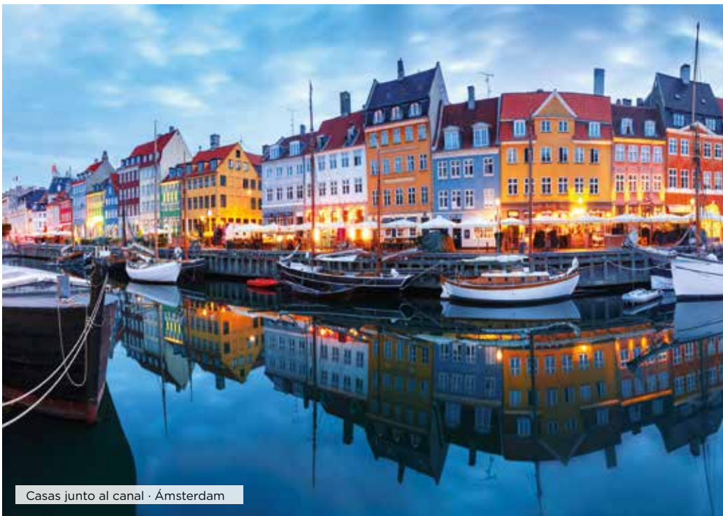
Casas junto al canal · Ámsterdam

Desayuno. Día libre para visitar alguno de sus muchos museos, conocer alguno de los parques de la ciudad, recorrer las calles de la moda o pasear por los diferentes barrios de la capital del Sena, desde el tradicional barrio de Le Marais, donde se encuentra la bellísima plaza de los Vosgos hasta el revolucionario barrio de las finanzas de La Defense, donde han dejado su sello los más importantes arquitectos del siglo XX y XXI en sus imponentes construcciones, donde destaca el Gran Arco de la Defense, diseñado por el arquitecto Otto Von Spreckelsen, y que se inauguró