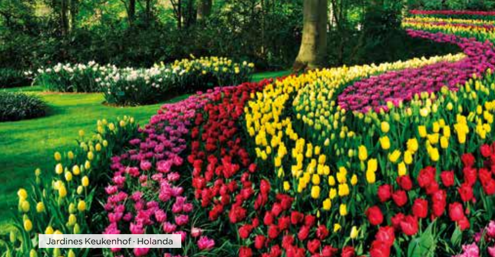
Jardines Keukenhof · Holanda