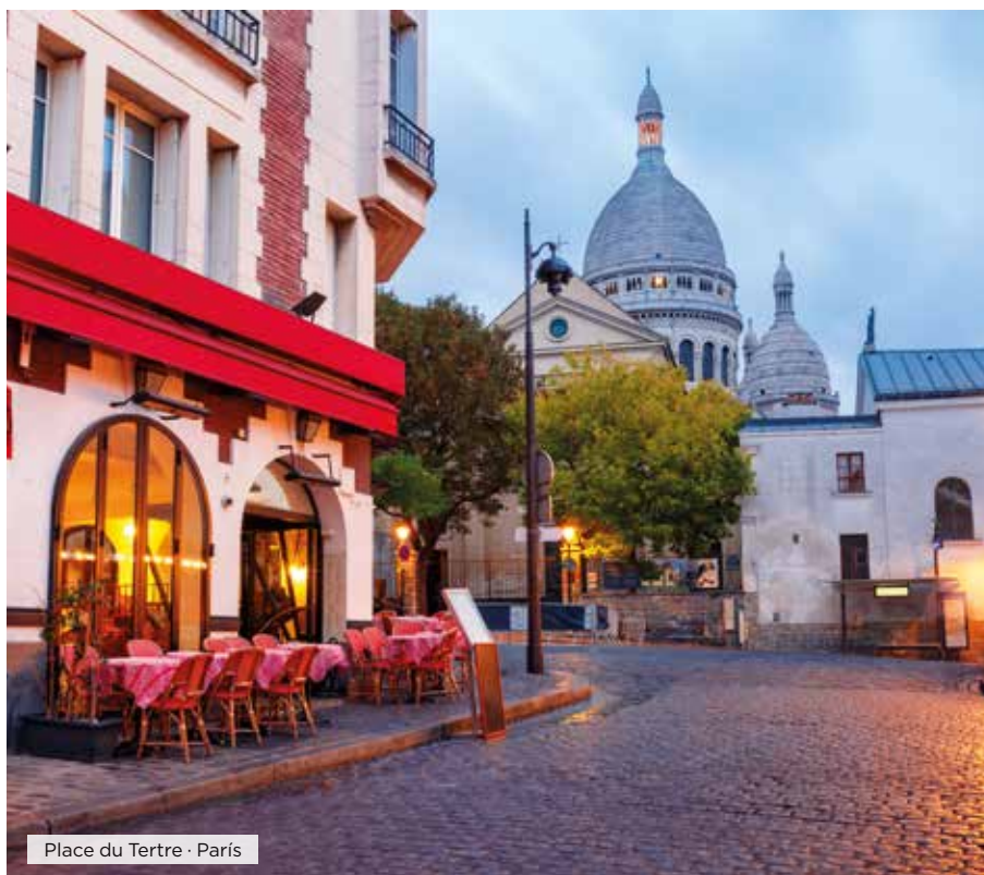
Place du Tertre · París

Hoteles alternativos y notas ver página web.