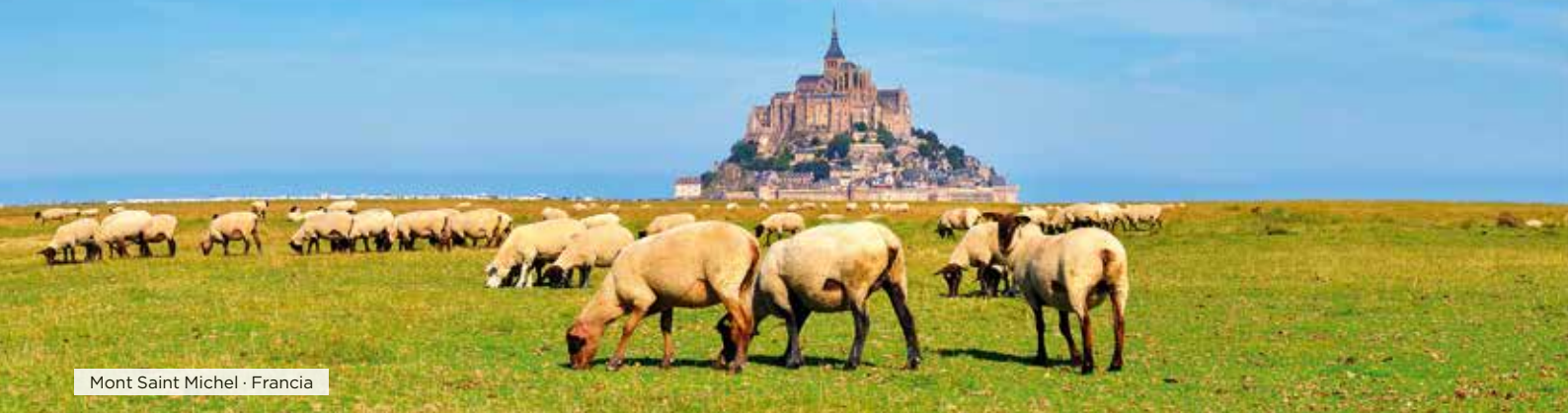
Mont Saint Michel · Francia