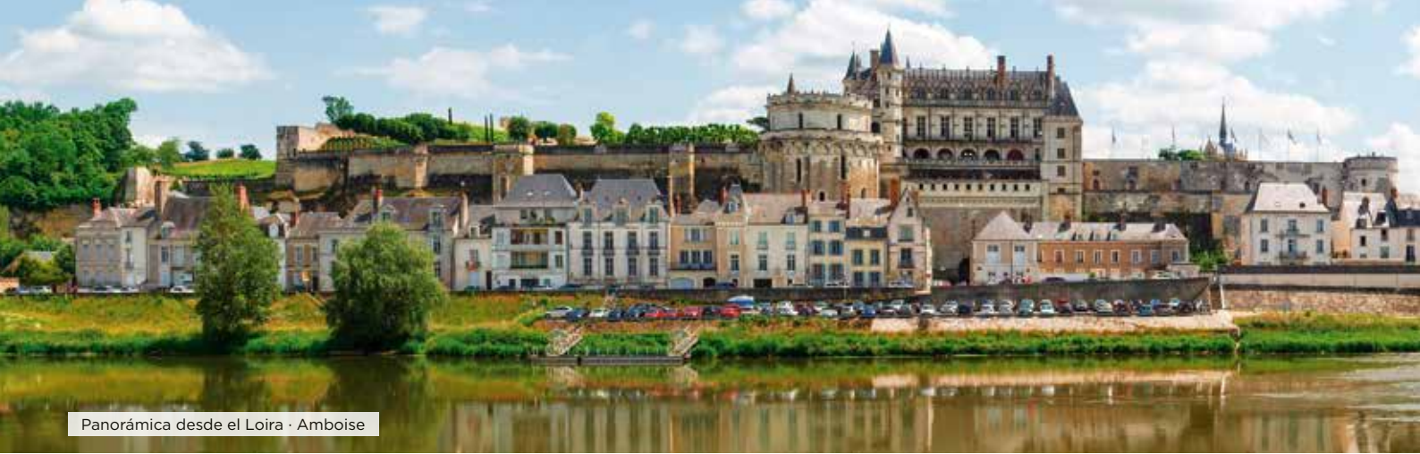
Panorámica desde el Loira · Amboise