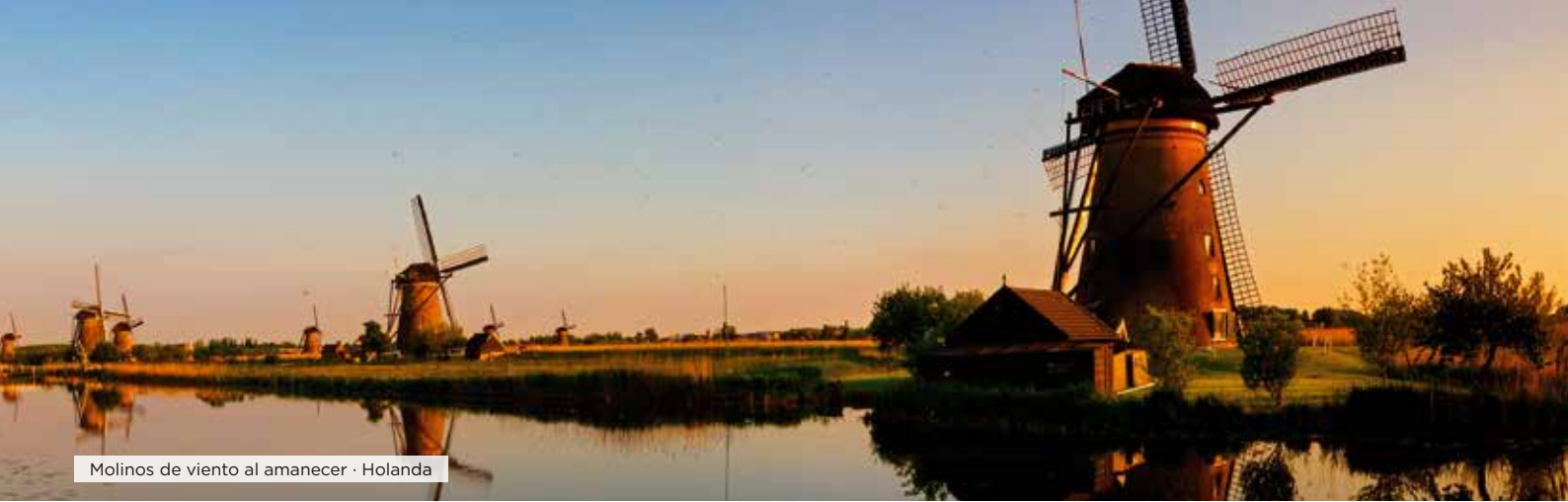
Molinos de viento al amanecer · Holanda