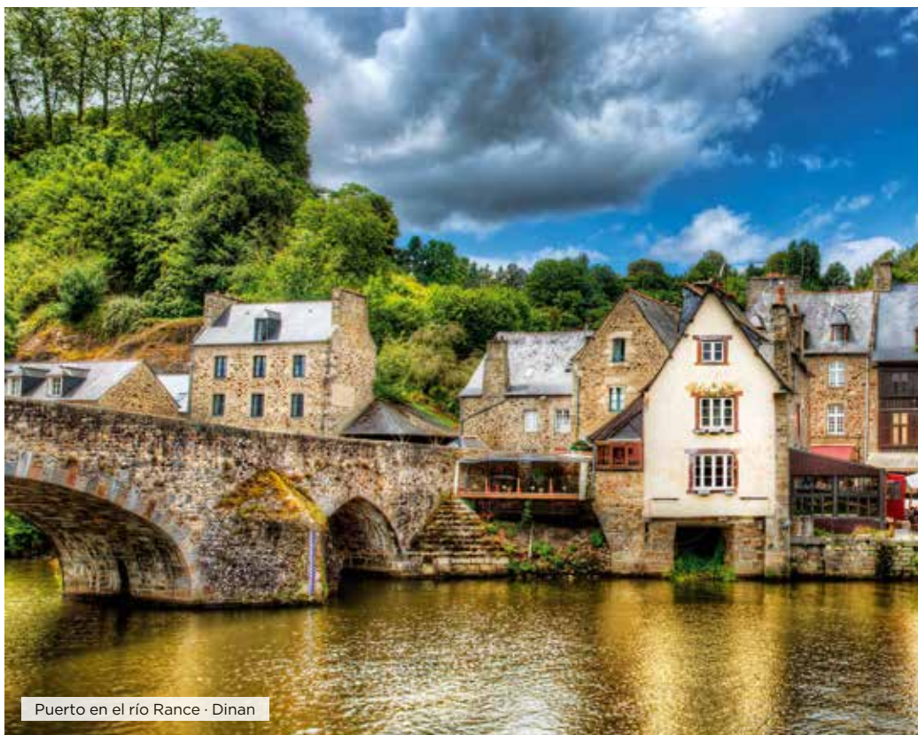
Puerto en el río Rance · Dinan

Desayuno. Salida hacia Nantes, la antigua capital de Bretaña y que será nuestra puerta de entrada a la Región del Loira. Almuerzo y visita panorámica con guía local en la que realizaremos un recorrido por su centro histórico, con sus hermosas fachadas de entramado de madera del siglo XV, la catedral de San Pedro y San Pablo, El Castillo de los Duques de Bretaña, residencia de la corte bretona y más tarde del rey de Francia, en el que se combina una mezcla de palacio refinado y de fortaleza, el Jardín de las Plantas, con 7 hectáreas de vegetación en pleno centro de la ciudad y más de 10.000 especies vivas, etc. Salida hacia Vannes. Cena y alojamiento.