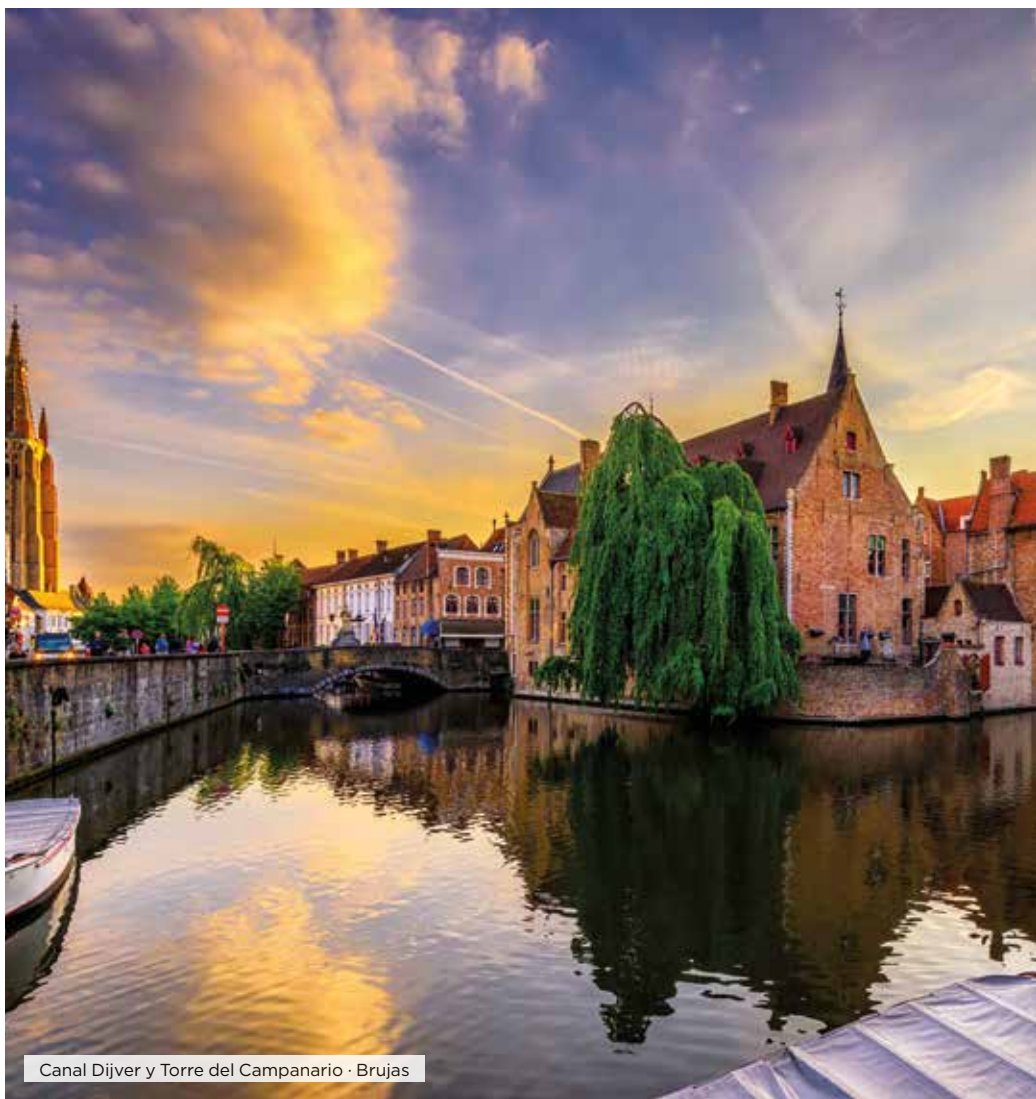
Canal Dijver y Torre del Campanario · Brujas

Desayuno. Día libre para seguir disfrutando de Londres, recorriendo sus zonas comerciales o visitando alguno de sus museos o si lo desea podrá realizar una interesantísima excursión opcional en la que nos dirigiremos a dos de los lugares más emblemáticos de la tradición británica. Saldremos de Londres con el guía local, que nos acompañará durante todo el recorrido y nos dirigiremos a Oxford, conocida como "la Ciudad de las Agujas de Ensueño" y donde se encuentra una de las universidades más famosas del mundo, que data del siglo XIII y por ella han pasado figuras como Bill Clinton, J R Tolkien, Lewis Carroll o Richard Burton. Conoceremos uno de sus famosos Colleges (entrada incluida) y tendremos también tiempo libre para realizar alguna compra o disfrutar de unos momentos de descanso, tomando un café en alguna de las terrazas de la ciudad. Esta excursión opcional continuará hacia Windsor, donde podremos descubrir una ciudad especial con animadas calles de trazado medieval llena de tiendas, pubs y casas de época rodeando la Plaza Central, donde podre-