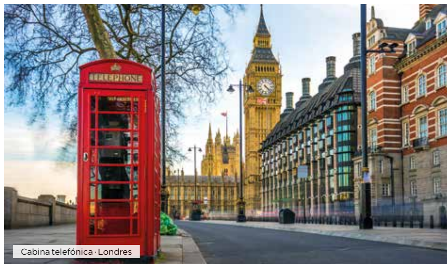
Cabina telefónica · Londres

Desayuno. Tiempo libre hasta el hora de traslado al aeropuerto para tomar el vuelo a su ciudad de destino. Fin de nuestros servicios. ■