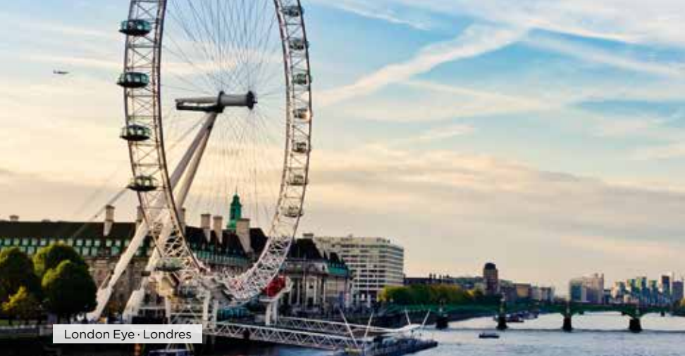
London Eye · Londres