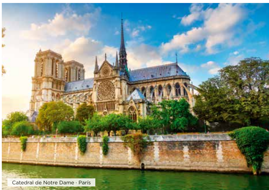
Catedral de Notre Dame · París

Desayuno. Tiempo libre hasta el hora de traslado al aeropuerto para tomar el vuelo a su ciudad de destino. Fin de nuestros servicios. ■