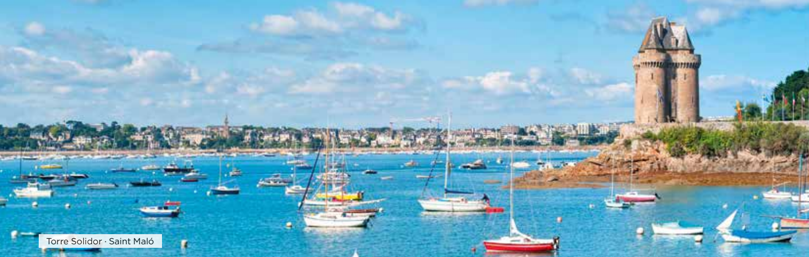
Torre Solidor · Saint Maló