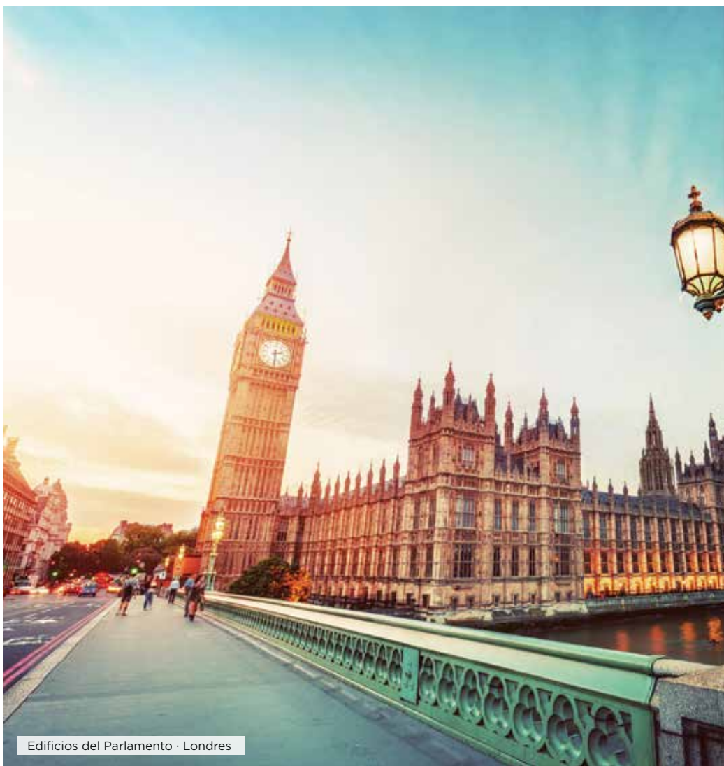
Edificios del Parlamento · Londres

Desayuno. Día libre para seguir disfrutando de Londres, recorriendo sus zonas comerciales o visitando alguno de sus museos o si lo desea podrá realizar una interesantísima excursión opcional en la que nos dirigiremos a dos de los lugares más emblemáticos de la tradición británica. Saldremos de Londres con el guía local, que nos acompañará durante todo el recorrido y nos dirigiremos a Oxford, conocida como “la Ciudad de las Agujas de Ensueño” y donde se encuentra una de las universidades más famosas del mundo, que data del siglo XIII y por ella han pasado figuras como Bill Clinton, J R Tolkien, Lewis Carroll o Richard Burton. Conoceremos uno de sus famosos Colleges (entrada incluida) y tendremos también tiempo libre para realizar alguna compra o disfrutar de unos momentos de descanso, tomando un café en alguna de las terrazas de la ciudad. Esta excursión opcional continuará hacia Windsor, donde podremos descubrir una ciudad especial con animadas calles de trazado medieval llena de tiendas, pubs y casas de época rodeando la Plaza Central, donde podre-