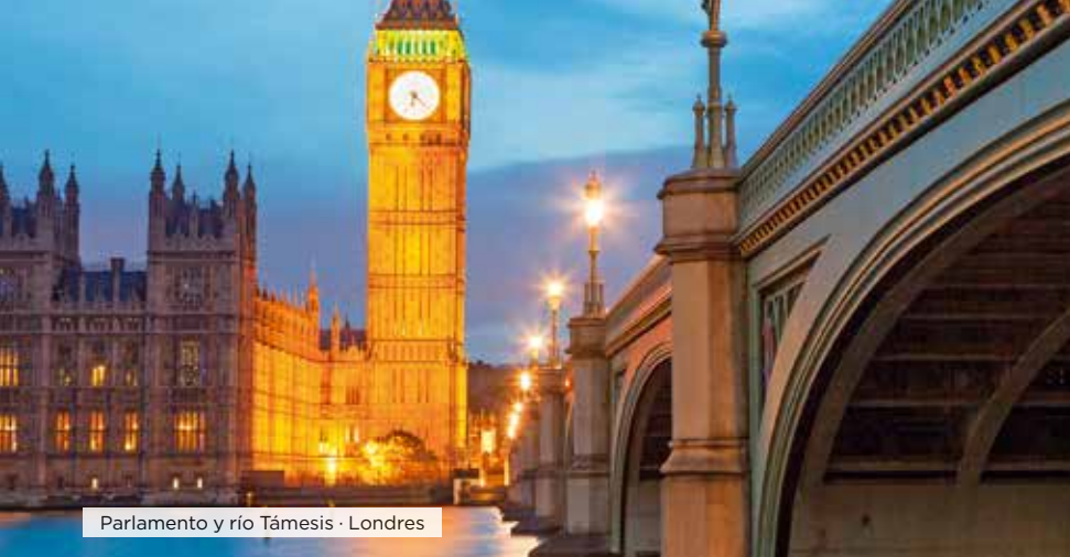
Parlamento y río Támesis · Londres