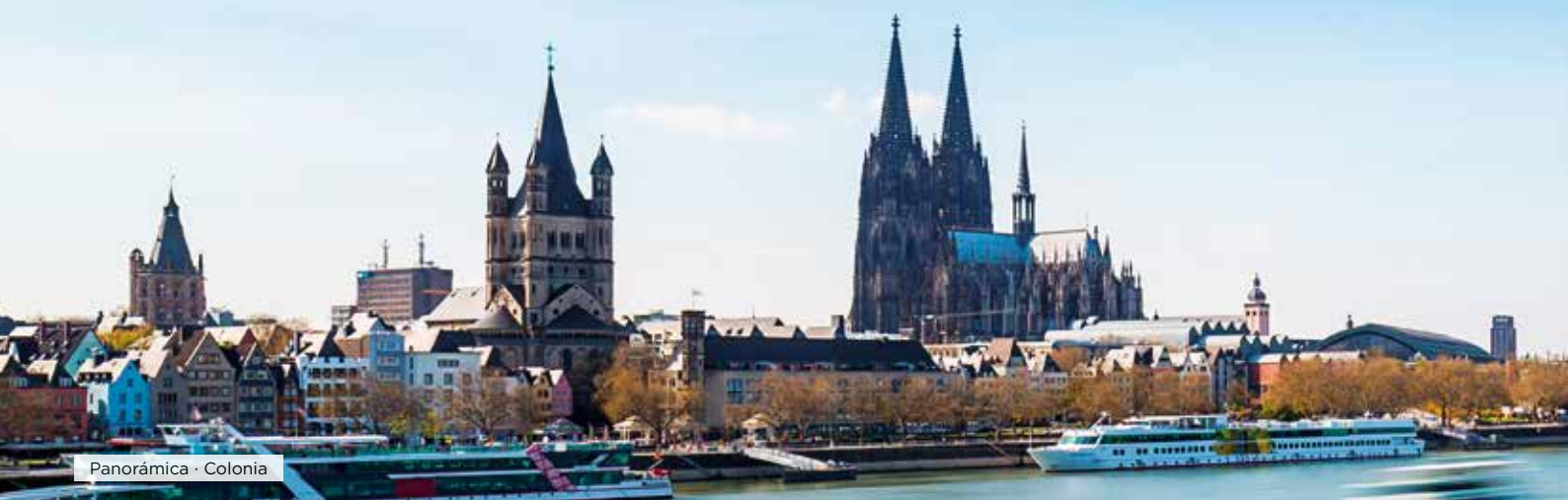
Panorámica · Colonia