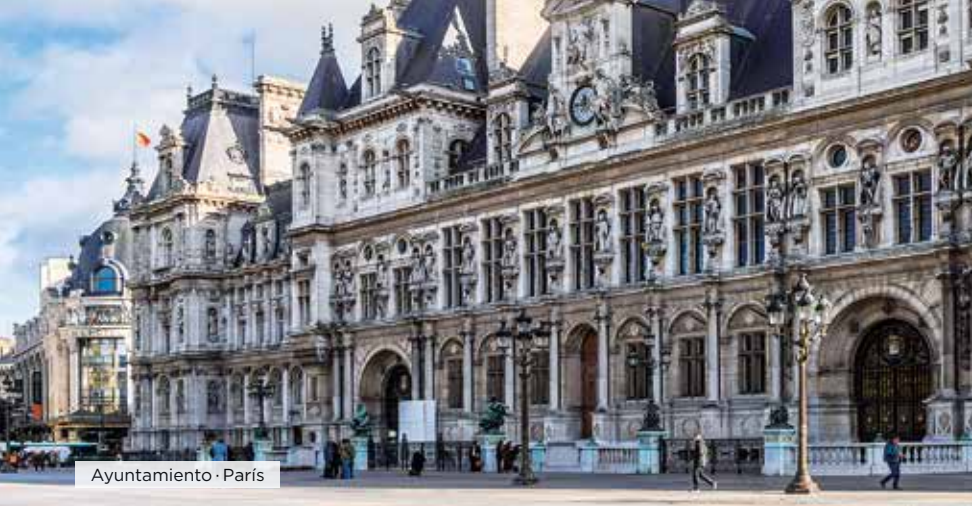
Ayuntamiento · París