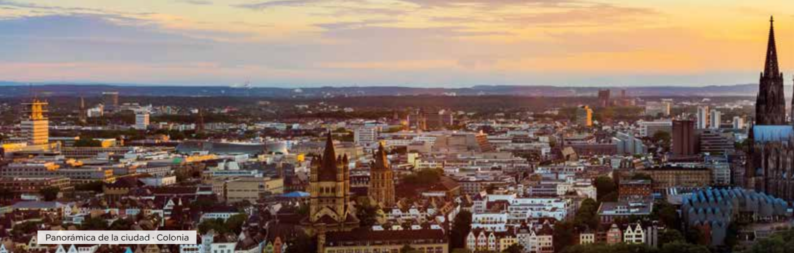
Panorámica de la ciudad · Colonia