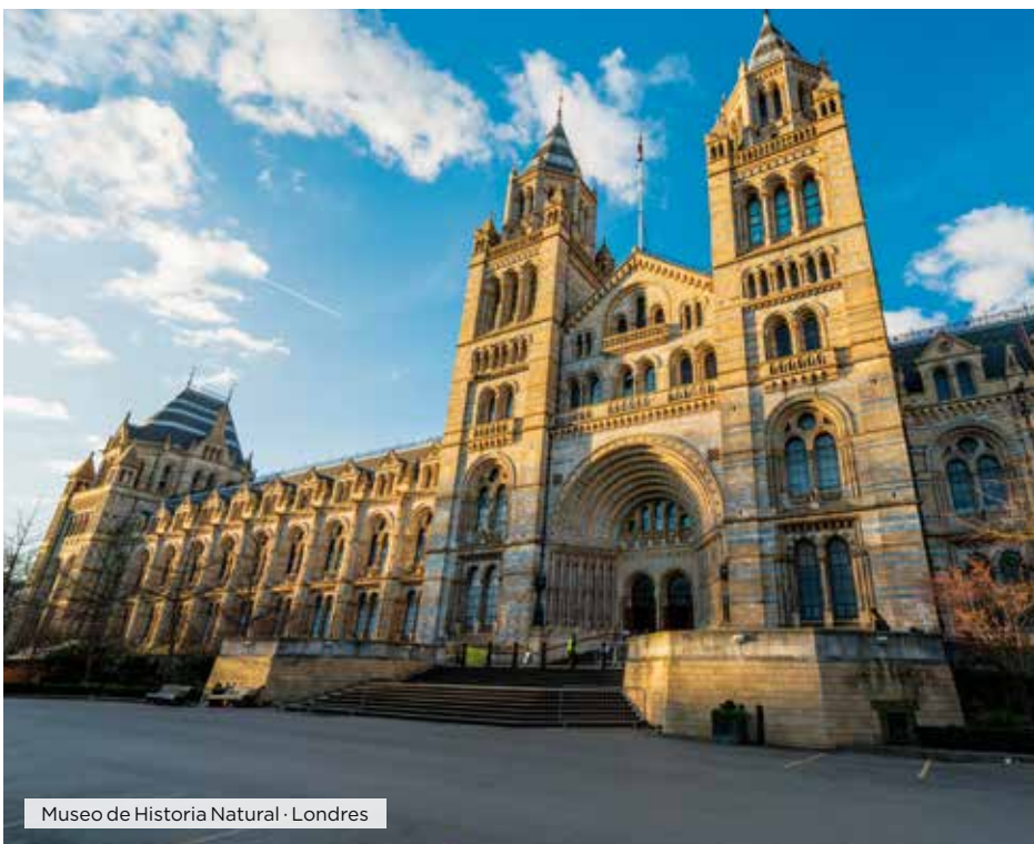
Museo de Historia Natural · Londres

Desayuno. Día libre para visitar alguno de sus muchos museos, conocer alguno de los parques de la ciudad, recorrer las calles de la moda o pasear por los diferentes barrios de la capital del Sena, desde el tradicional barrio de Le Marais, donde se encuentra la bellísima plaza de los Vosgos hasta el revolucionario barrio de las finanzas de La Defense, donde han dejado su sello los más importantes arquitectos del siglo XX y XXI en sus imponentes construcciones, donde destaca el Gran Arco de la Defense, diseñado por el arquitecto Otto Von Spreckelsen, y que se inauguró en 1989 para conmemorar el bicentenario de la Revolución Francesa. Alojamiento.