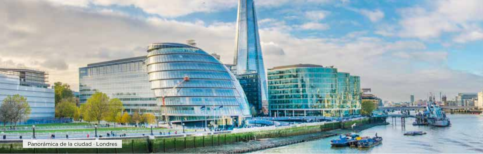
Panorámica de la ciudad · Londres