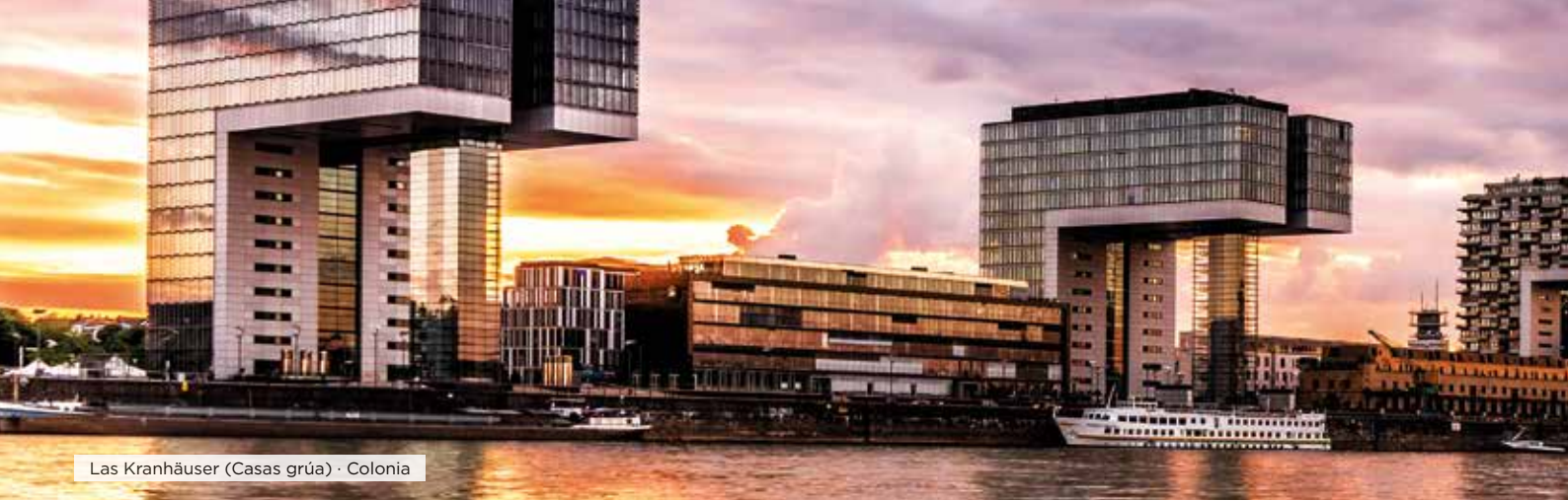
Las Kranhäuser (Casas grúa) · Colonia