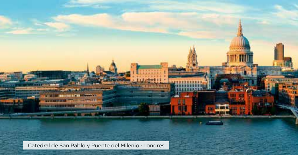
Catedral de San Pablo y Puente del Milenio · Londres