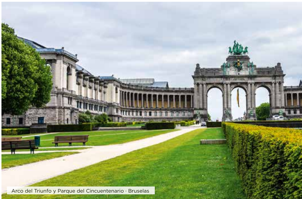
Arco del Triunfo y Parque del Cincuentenario · Bruselas

Desayuno. Día libre para seguir disfrutando de Londres, recorriendo sus zonas comerciales o visitando alguno de sus museos o si lo desea podrá realizar una interesantísima excursión opcional en la que nos dirigiremos a dos de los lugares más emblemáticos de la tradición británica. Saldremos de Londres con el guía local, que nos acompañará durante todo el recorrido y nos dirigiremos a Oxford, conocida como “la Ciudad de las Agujas de Ensueño” y donde se encuentra una de las universidades más famosas del mundo, que data del siglo XIII y por ella han pasado figuras como Bill Clinton, J R Tolkien, Lewis Carroll o Richard Burton. Conoceremos uno de sus famosos Colleges (entrada incluida) y tendremos también tiempo libre para realizar alguna compra o disfrutar de unos momentos de descanso, tomando un café en alguna de las terrazas de la ciudad. Esta excursión opcional continuará hacia Windsor, donde podremos descubrir una ciudad especial con animadas calles de trazado medieval llena de tiendas, pubs y casas de época rodeando la Plaza Central, donde podre-