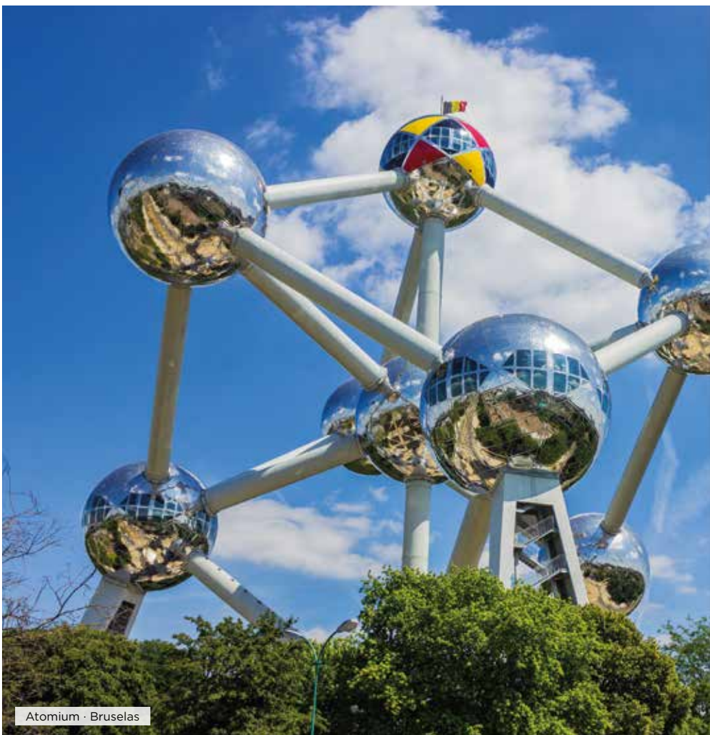
Atomium · Bruselas

Desayuno. Salida hacia La Haya, la ciudad de los palacios y las avenidas, de las embajadas y los ministerios, es la sede del gobierno de los Países Bajos,