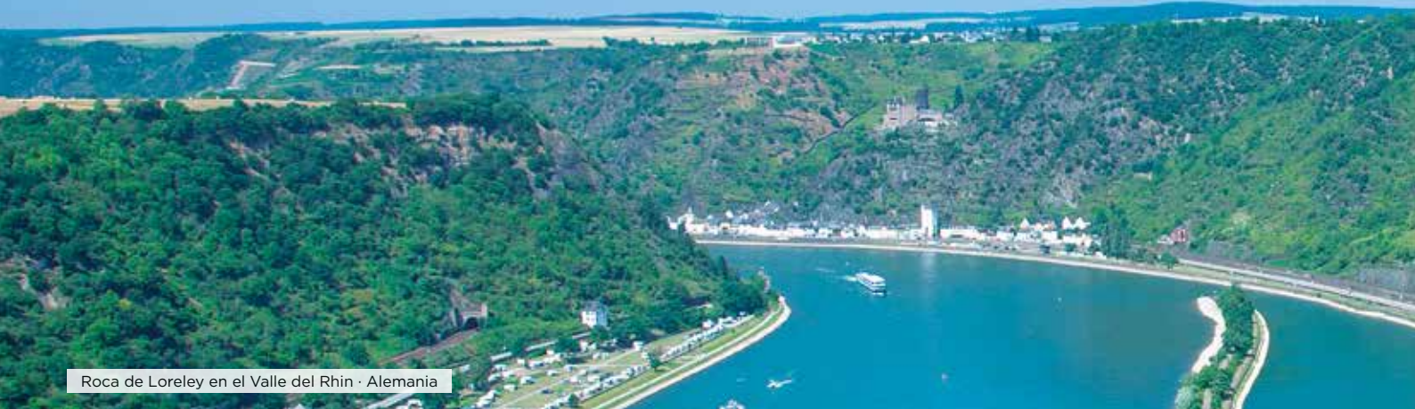
Roca de Loreley en el Valle del Rin · Alemania