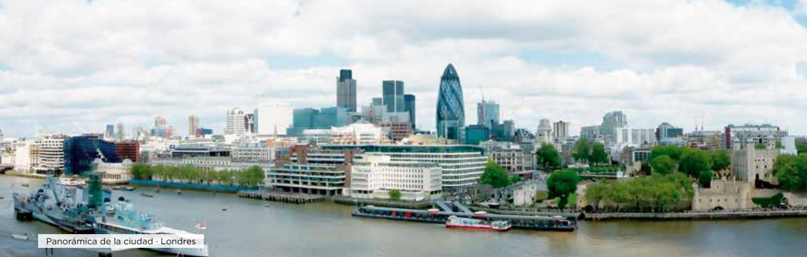
Panorámica de la ciudad · Londres