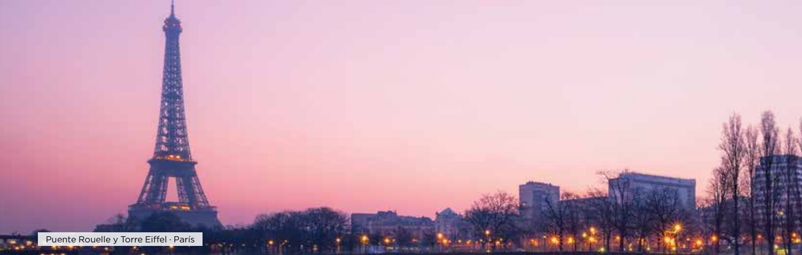
Puente Rouelle y Torre Eiffel · París