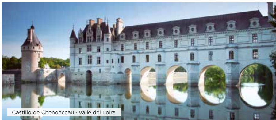
Castillo de Chenonceau · Valle del Loira

Desayuno. Tiempo libre hasta el momento del traslado al aeropuerto para tomar el vuelo a su ciudad de destino. Fin de nuestros servicios. ■