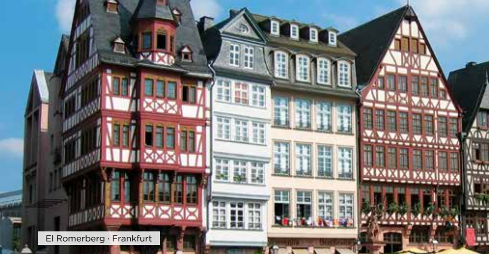
El Römerberg · Frankfurt