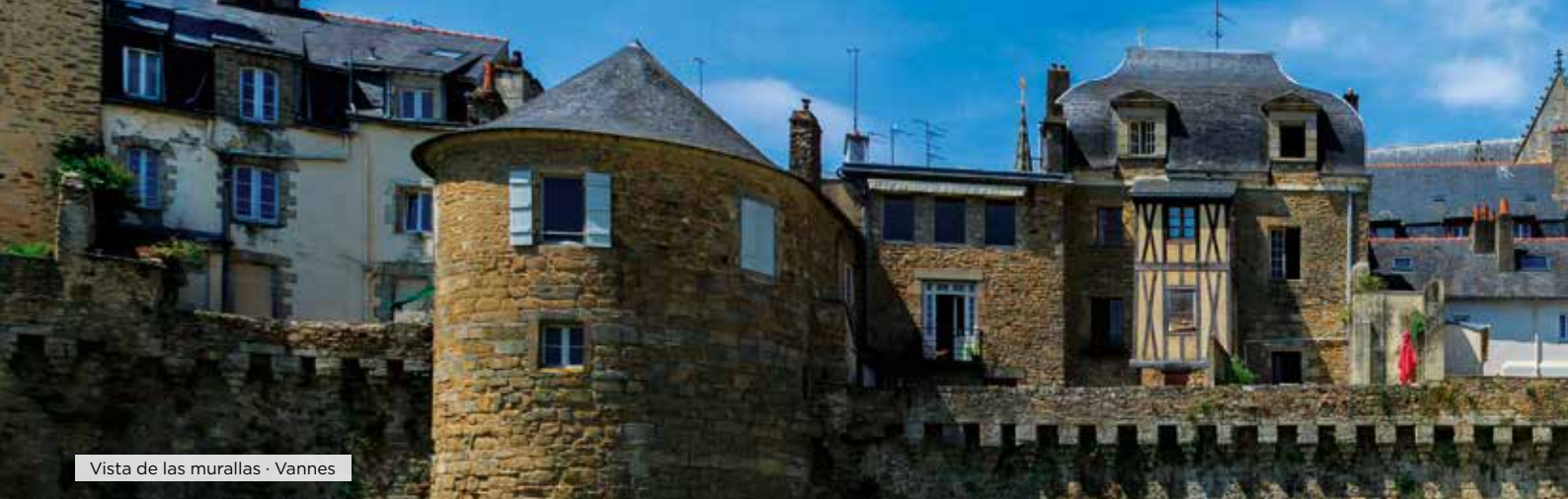
Vista de las murallas · Vannes