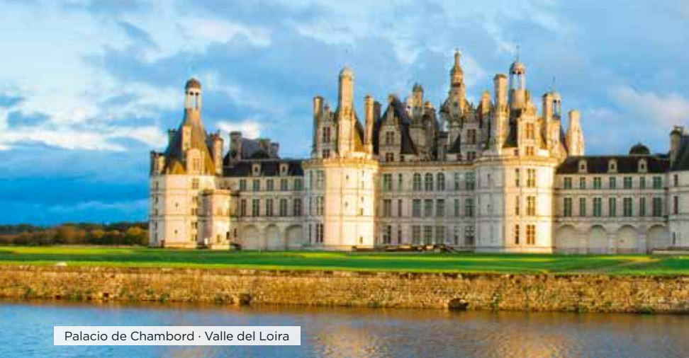
Palacio de Chambord · Valle del Loira