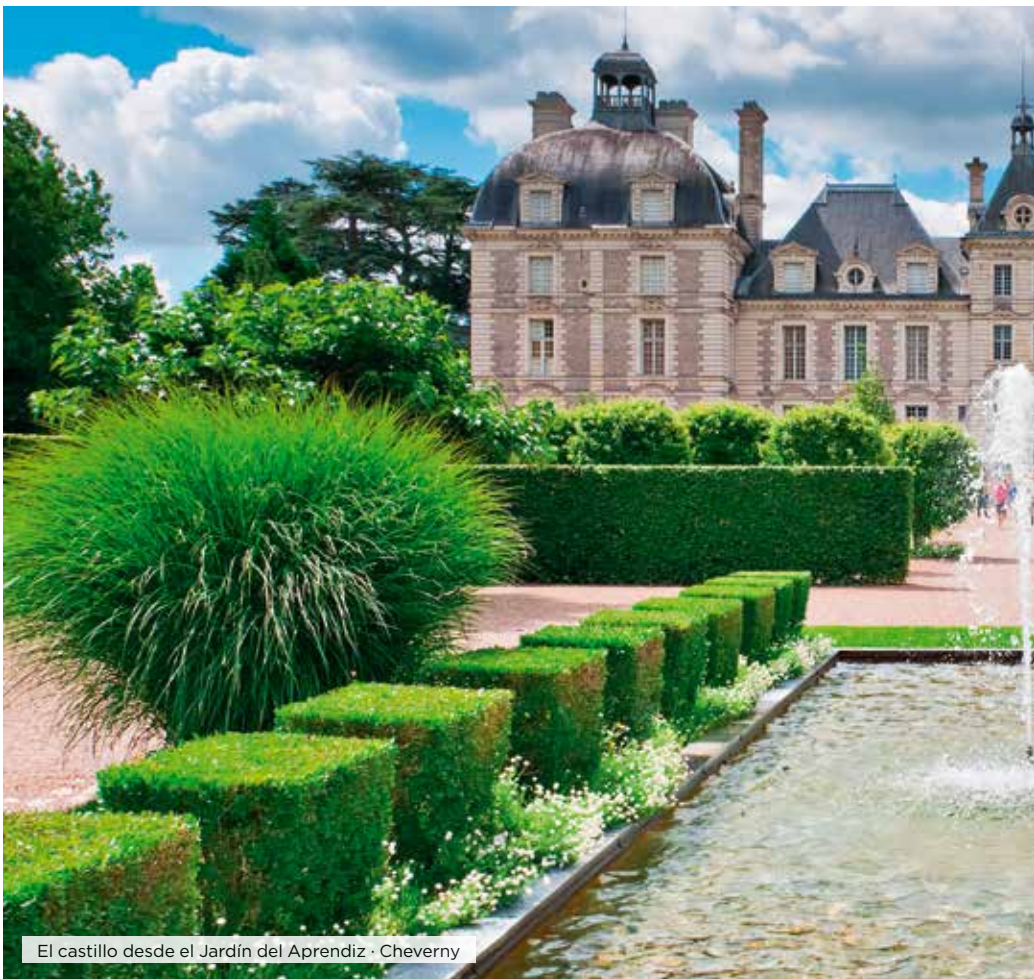
El castillo desde el Jardín del Aprendiz · Cheverny

Desayuno. Día libre para visitar alguno de sus muchos museos, conocer alguno de los parques de la ciudad, recorrer las calles de la moda o pasear por los diferentes barrios de la capital del Sena, desde el tradicional barrio de Le Marais, donde se encuentra la bellísima plaza de los Vosgos hasta el revolucionario barrio de las finanzas de La Defense, donde han dejado su sello los más importantes arquitectos del siglo XX y XXI en sus imponentes construcciones, donde destaca el Gran Arco de la Defense, diseñado por el arquitecto Otto Von Spreckelsen, y que se inauguró en 1989 para conmemorar el bicentenario de la Revolución Francesa. Alojamiento.