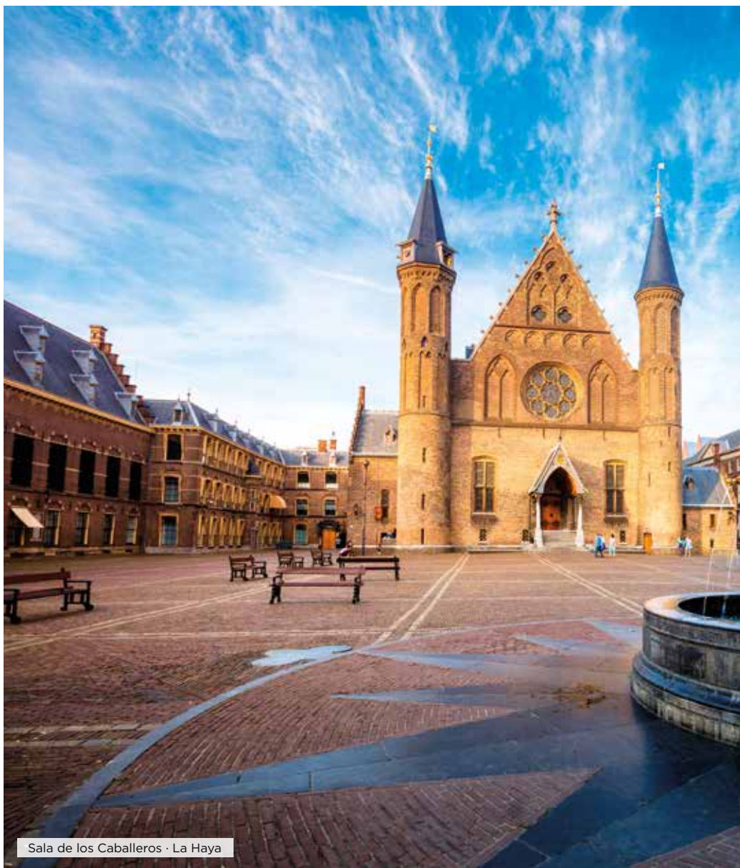
Sala de los Caballeros · La Haya

* Eventualmente El alojamiento se podrá realizar en Brujas o Bruselas indistintamente, manteniendo los servicios del programa.