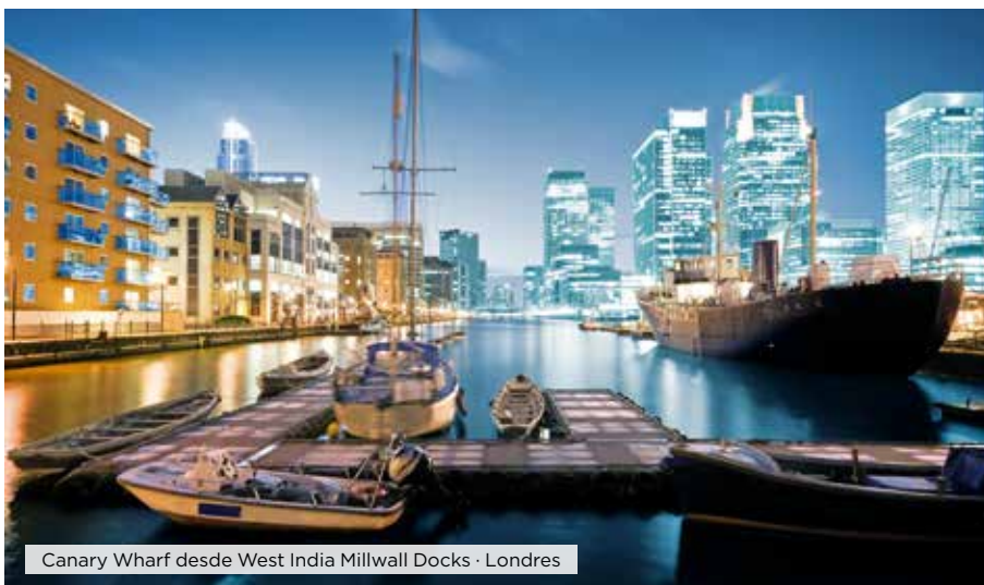
Canary Wharf desde West India Millwall Docks · Londres

Hoteles alternativos y notas ver página web.