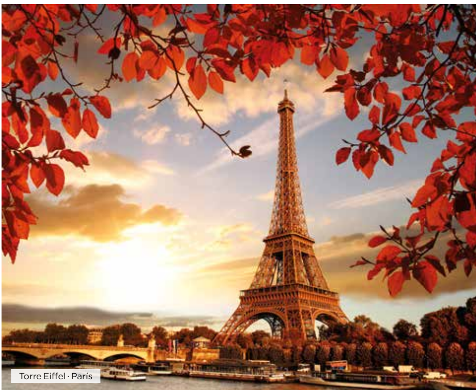
Torre Eiffel · París

Desayuno. Día libre para visitar alguno de sus muchos museos, conocer alguno de los parques de la ciudad, recorrer las calles de la moda o pasear por los diferentes barrios de la capital del Sena, desde el tradicional barrio de Le Marais, donde se encuentra la bellísima plaza de los Vosgos hasta el revolucionario barrio de las finanzas de La Defense, donde han dejado su sello los más importantes arquitectos del siglo XX y XXI en sus imponentes construcciones, donde destaca el Gran Arco de la Defense, diseñado por el arquitecto Otto Von Spreckelsen, y que se inauguró en 1989 para conmemorar el bicentenario de la Revolución Francesa. Alojamiento.