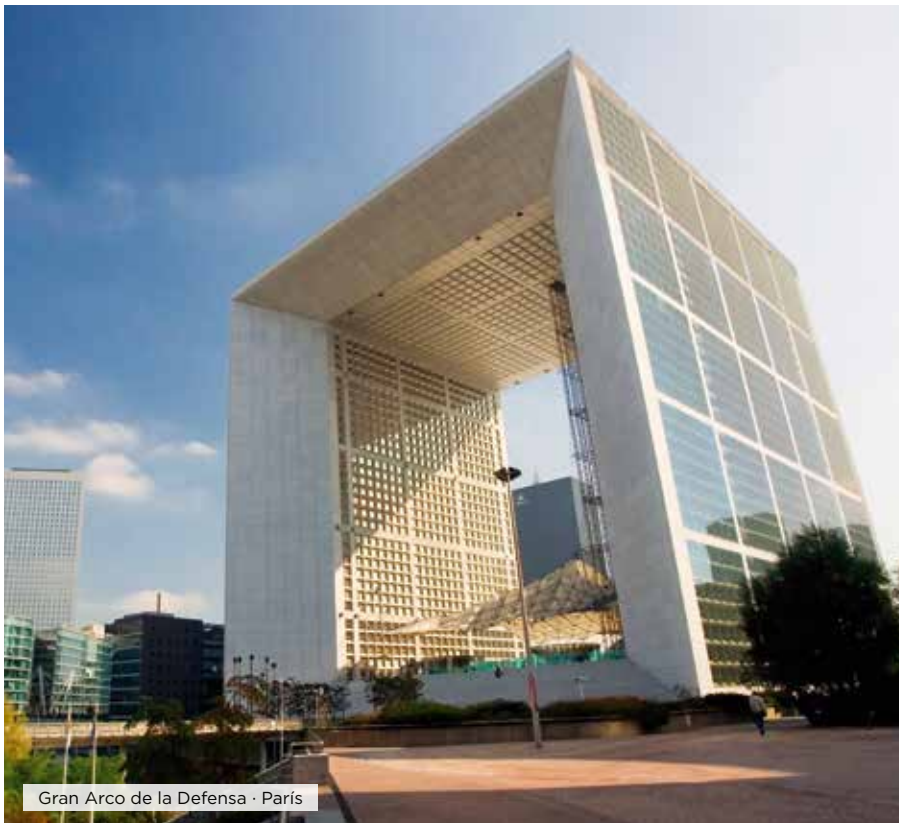
Gran Arco de la Defensa · París

Desayuno. Tiempo libre hasta el hora de traslado al aeropuerto para tomar el vuelo a su ciudad de destino. Fin de nuestros servicios. ■