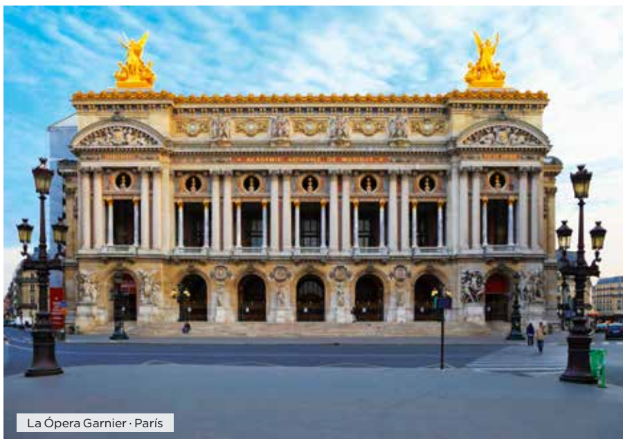
La Ópera Garnier · París

Hoteles alternativos y notas ver página web.