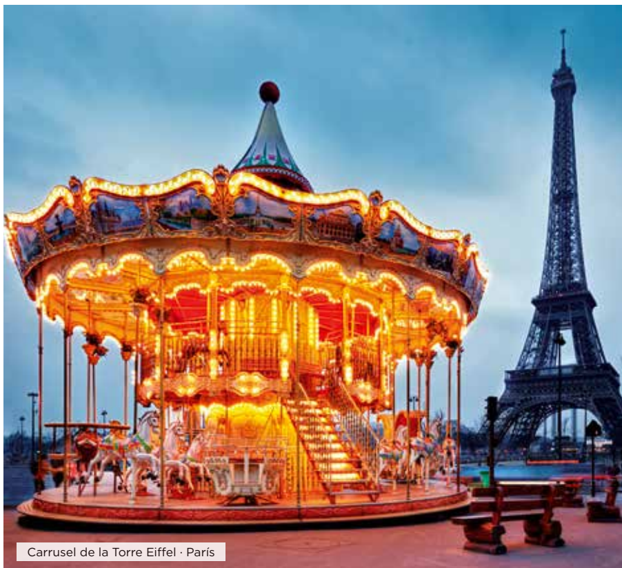
Carrusel de la Torre Eiffel · París

Hoteles alternativos y notas ver página web.