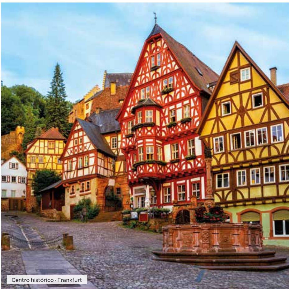
Centro histórico · Frankfurt

Desayuno. Día libre para visitar alguno de sus muchos museos, conocer alguno de los parques de la ciudad, recorrer las calles de la moda o pasear por los diferentes barrios de la capital del Sena, desde el tradicional barrio de Le Marais, donde se encuentra la bellísima plaza de los Vosgos hasta el revolucionario barrio de las finanzas de La Defense, donde han dejado su sello los más importantes arquitectos del siglo XX y XXI en sus imponentes construcciones, donde destaca el Gran Arco de la Defense, diseñado por el arquitecto Otto Von Spreckelsen, y que se inauguró en 1989 para conmemorar el bicentenario de la Revolución Francesa. Alojamiento.