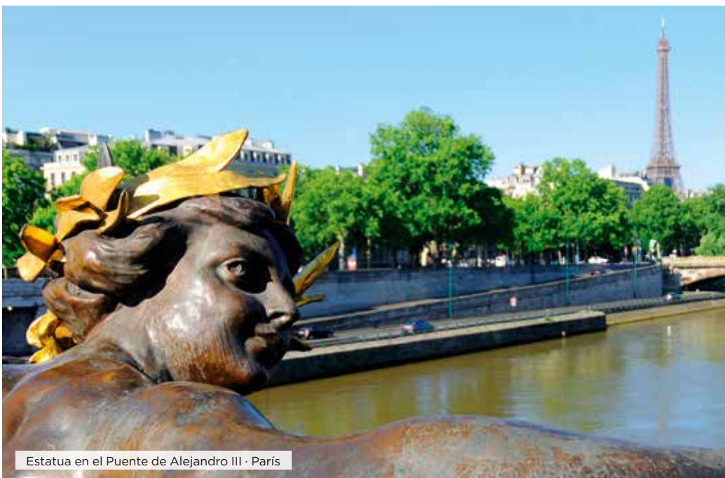
Estatua en el Puente de Alejandro III · París

Desayuno. Día libre para seguir disfrutando de Londres, recorriendo sus zonas comerciales o visitando alguno de sus museos o si lo desea podrá realizar una interesantísima excursión opcional en la que nos dirigiremos a dos de los lugares más emblemáticos de la tradición británica. Saldremos de Londres con el guía local, que nos acompañará durante todo el recorrido y nos dirigiremos a Oxford, conocida como "la Ciudad de las Agujas de Ensueño" y donde se encuentra una de las universidades más famosas del mundo, que data del siglo XIII y por ella han pasado figuras como Bill Clinton, J R Tolkien, Lewis Carroll o Richard Burton. Conoceremos uno de sus famosos Colleges (entrada incluida) y tendremos también tiempo libre para realizar alguna compra o disfrutar de unos momentos de descanso, tomando un café en alguna de las terrazas de la ciudad. Esta excursión opcional continuará hacia Windsor, donde podremos descubrir una ciudad especial con animadas calles de trazado medieval llena de tiendas, pubs y casas de época rodeando la Plaza Central, donde podre-