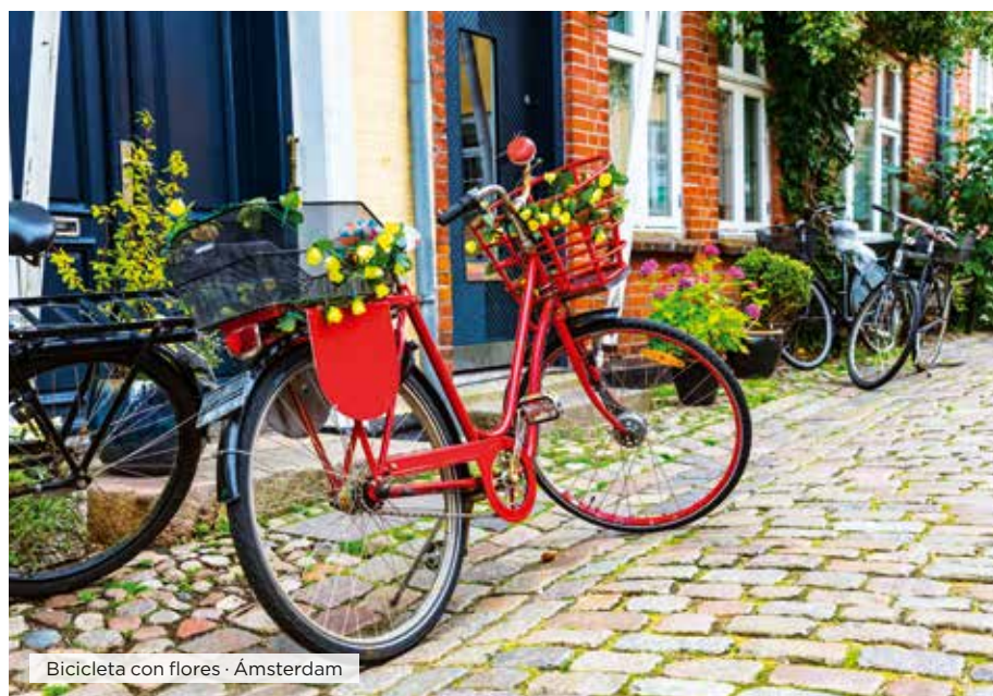
Bicicleta con flores · Ámsterdam

Desayuno. Tiempo libre hasta el hora de traslado al aeropuerto para tomar el vuelo a su ciudad de destino. Fin de nuestros servicios. ■