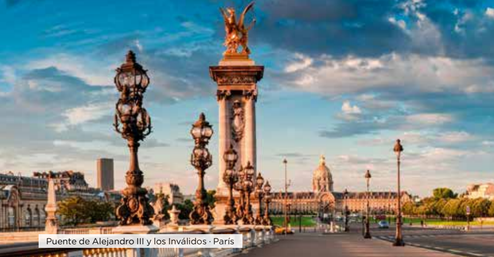
Puente de Alejandro III y los Inválidos · París