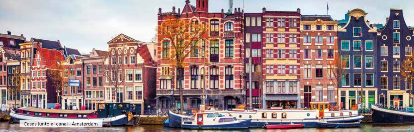
Casas junto al canal · Ámsterdam