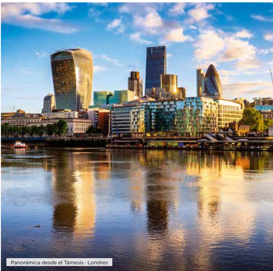
Panorámica desde el Támesis · Londres

Desayuno. Día libre para visitar alguno de sus muchos museos, conocer alguno de los parques de la ciudad, recorrer las calles de la moda o pasear por los diferentes barrios de la capital del Sena, desde el tradicional barrio de Le Marais, donde se encuentra la bellísima plaza de los Vosgos hasta el revolucionario barrio de las finanzas de La Defense, donde han dejado su sello los más importantes arquitectos del siglo XX y XXI en sus imponentes construcciones, donde destaca el Gran Arco de la Defense, diseñado por el arquitecto Otto Von Spreckelsen, y que se inauguró en 1989 para conmemorar el bicentenario de la Revolución Francesa. Alojamiento.