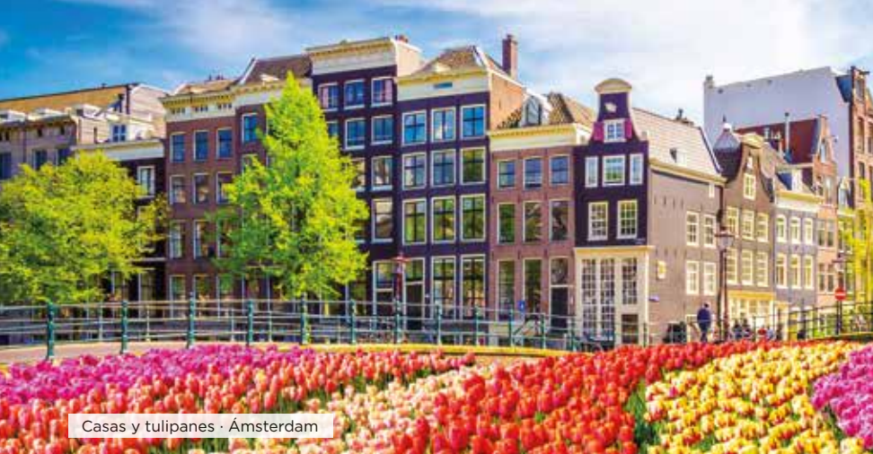
Casas y tulipanes · Ámsterdam